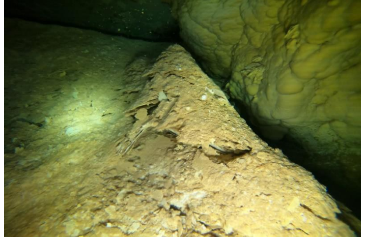
Conos en diversas zonas de Cueva del Agua