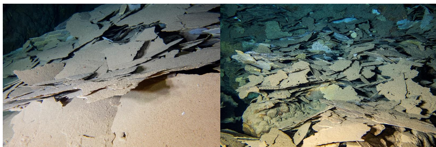
Laminas de calcita flotante